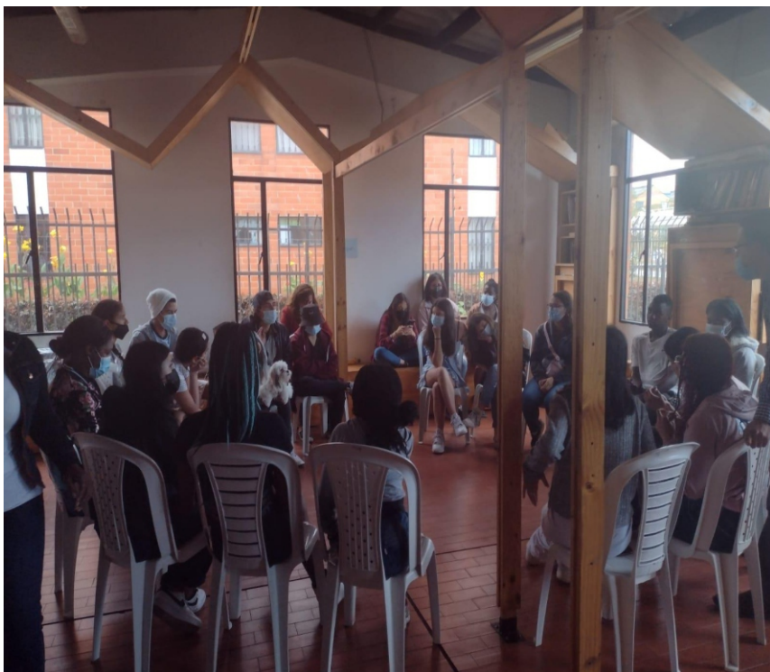
titulo expresion de los jovenes

En este primer encuentro se realizo socialización de la iniciativa con los jóvenes y padres para a conocer la finalidad y la importancia de realización permanente de este tipo de actividades con los jóvenes